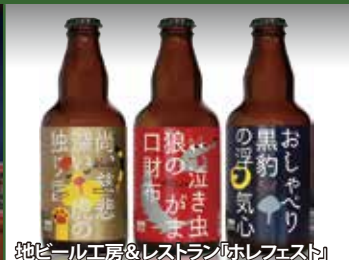
純ビール工房&レストラン「ホレフェスト」