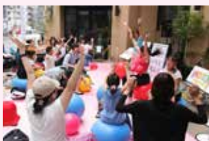
協力:一般社団法人体力メンテナンス協会