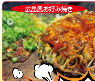
広島風お好み焼き