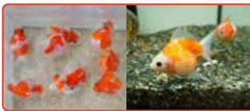
●リミックスの金魚すくい・虫くじ