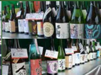
地元あいちの地酒を試飲・販売します