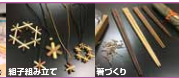
ハンカチマール染め 組子組み立て 箸づくり