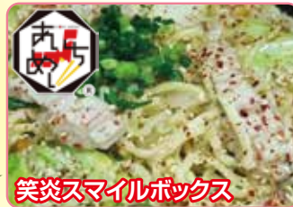
笑炎スマイルボックス