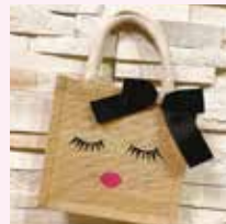
ジュートバッグアレンジ 講師:Couturie' 河合智子