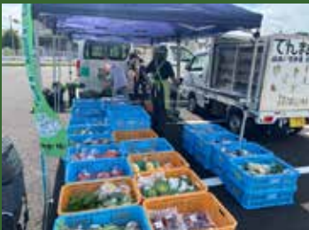
JAあいち中央「でんまあと号」が新鮮な野菜と果物を届けます